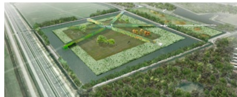
Centraal in Dwaalster zijn de grote hagen in de vorm van een ster.

Audrey Stielstra, bedrijfsleidster in het park waarvan Stichting Op Touthenburg eigenaar is. Vijversburg is namelijk een particulier park en ontvangt geen subsidie. Om het park te onderhouden en in stand te houden, is het park op zoek naar Vrienden die het park financieel ondersteunen.